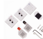
Cella a Combustibile Scomposta