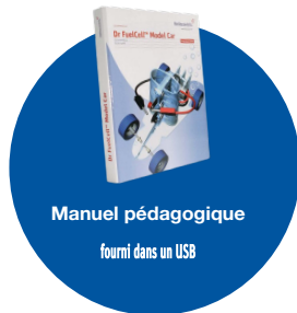
Manuel pédagogique fourni dans un USB

Modèle réduit de voiture à pile à hydrogène et à énergie solaire pour l'enseignement