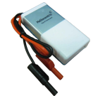
Génératrice à main